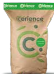
Conditionnement : Sac de 15 kg