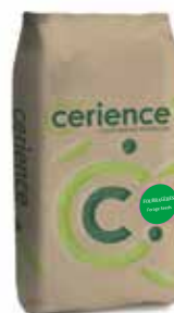
Conditionnement : Sac de 25 kg